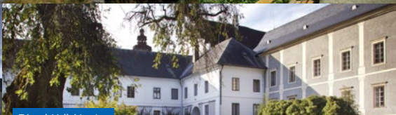
Zámek Velké Losiny