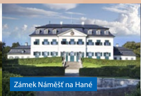
Zámek Náměšť na Hané