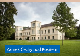
Zámek Čechy pod Kosířem