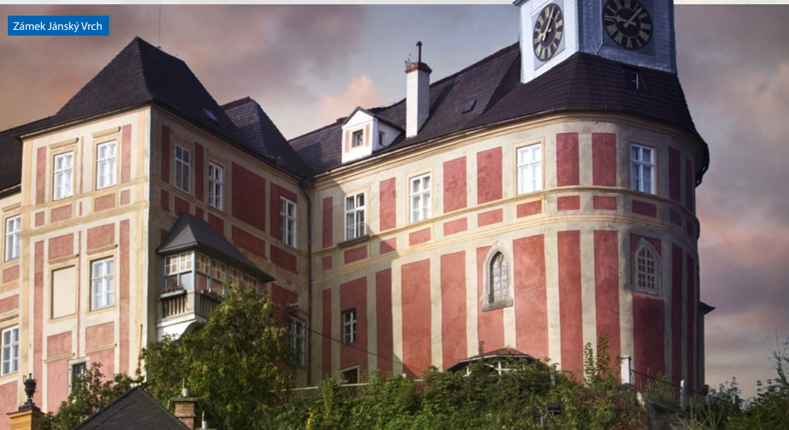
Zámek Jánský Vrch

Květen, červen: úterý, středa, čtvrtek: 9:00 – 11:00, 13:00 – 15:00, pondělí, pátek zavřeno, červenec, srpen: úterý, čtvrtek: 9:00 – 11:00, 13:00 – 15:00, pondělí, středa, pátek zavřeno, září: úterý: 9:00 – 11:00, 13:00 – 15:00, pondělí, středa, čtvrtek, pátek zavřeno